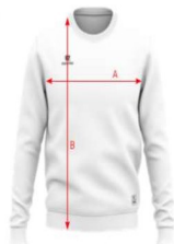
MOD. DUST SUDADERA TÉCNICA MANGA LARGA CUELLO REDONDO

A - ANCHO DE PRENDA Chest width B - ALTO DE PRENDA Height